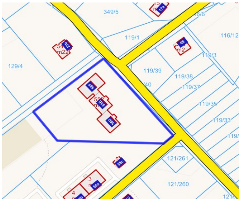
Szkic lokalu nr 9