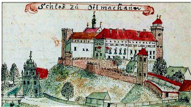
Rys. 3. Zamek w połowie XVIII w. ryc. CH.F.B. Wernhera, źródło: Leksykon Zamków w Polsce, L. Kajzer, S. Kołodziejki, J. Salm, Arkady 2002 http://www.zamkipolskie.com/otmuchow/otmuchow.html

Wzniesiony w XIII w., w miejscu grodu drewnianego. Zniszczony i odbudowany w XIII w., rozbudowany w latach 1484 - 1485 - skrzydło wschodnie, w k. XVI w. - skrzydła pld.