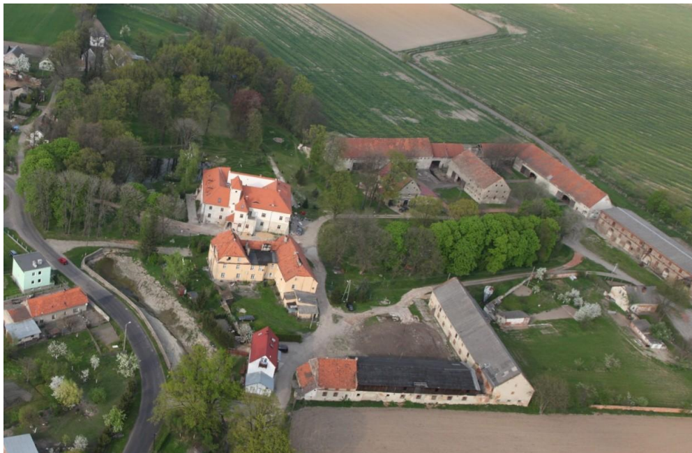
Zdjęcie nr 1. Zespół pałacowo folwarczny z parkiem, Piotrowice Nyskie, 2011

W gminie Otmuchów najważniejszym zespołem rezydencjonalnym jest zamek Otmuchowski z dziedzińcem i parkiem. Jest własnością komunalną i obecnie pełni funkcje o charakterze hotelowo - gastronomicznym. Obiekt nie posiada ekspozycji muzealnej, jest udostępniony do zwiedzania dla grup oraz turystów indywidualnych.