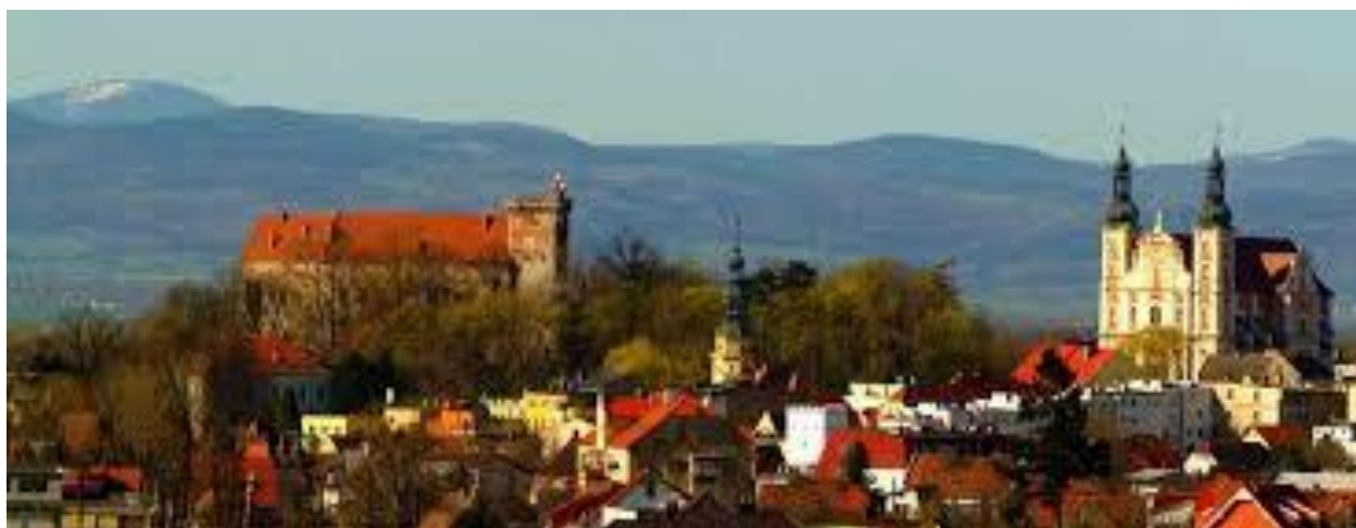
Otmuchów 2023 rok