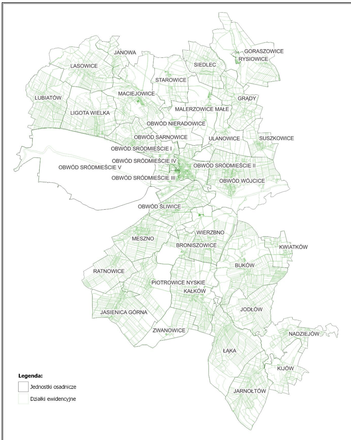
Rysunek 1. Podział gminy Otmuchów na jednostki osadnicze