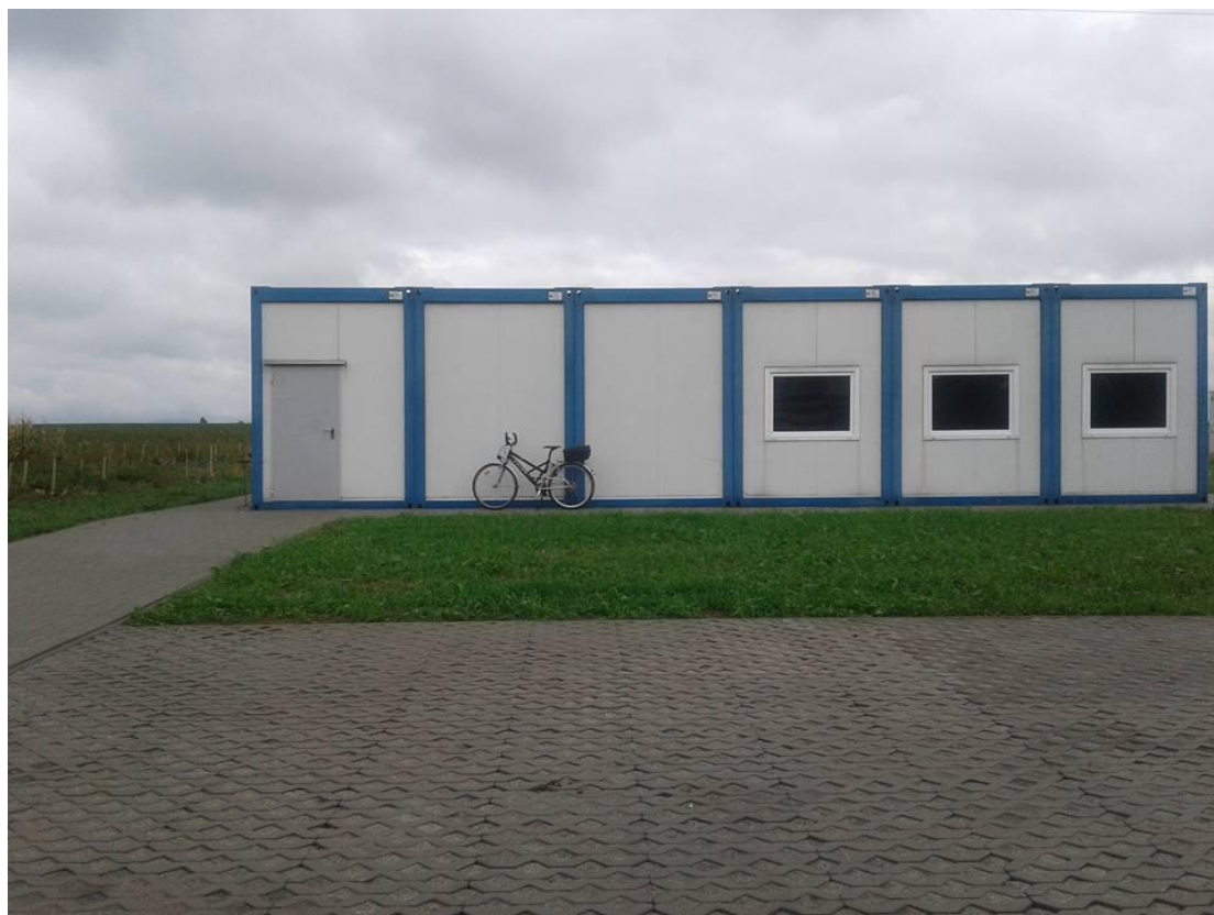
Świetlica wiejska Wierzbno.