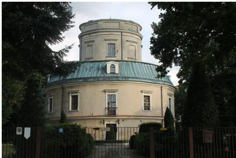
Zabytkowy Pałacyk myśliwski w Zwierzyńcu własność prywatna